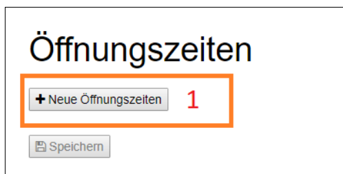
Abbildung 4: Öffnungszeiten 1 von 2